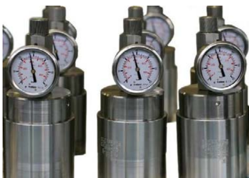
Manometro su smorzatore Pressure gauge on dampener