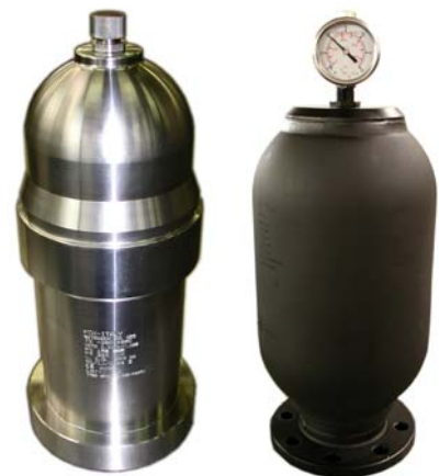
Flangia integrate senza filetti/saldature Integral flange without thread/welds