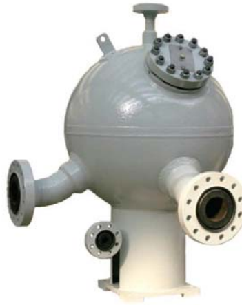
Risonatore sferico in linea In line spherical resonator