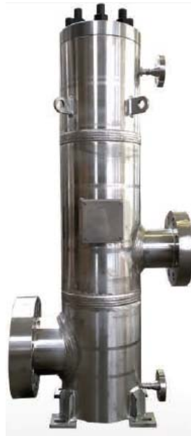
Smorzatore in linea In line Pulsation Damper