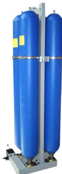
Batterie di accumulatori Battery of accumulator

In this page it is not possible to include all the special executions made by FOX during its 40 years of experience in accumulators and dampeners. Through this experience with passion and dedication, which is oriented to the complete satisfaction of customer needs, FOX is able to offer technical support that can help you to find a solution for all those applications that require different characteristics than those provided by the standard material. Therefore, we recommend to contact our technical office for any question.