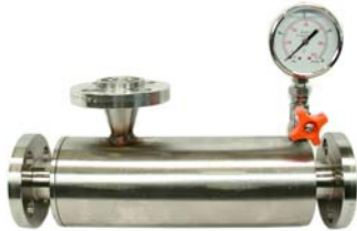
Silenziatori in linea In line silencer